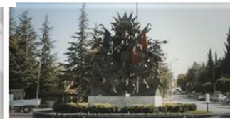
Bilecik Seyh Elebali University / 터키