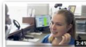
MacArthur Veterinary Group / 호주