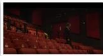
Millfield Arts Centre / 영국