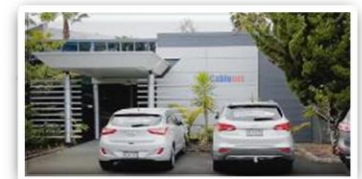
CableNet / 뉴질랜드