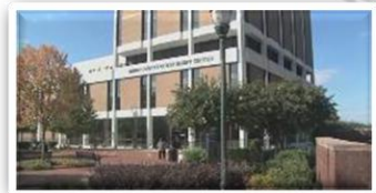
Union County Government Center / 미국