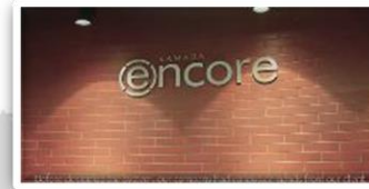
Ramada Hotel / 우크라이나