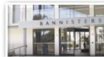
Bannisters Hotel / 호주

*링크를 통하여 유튜브에 등재된 iPECS 사례영상을 보실 수 있습니다.