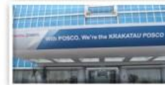
Krakatau POSCO / 인도네시아