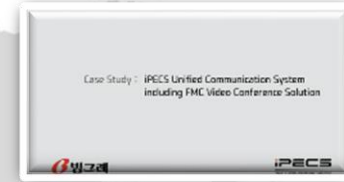
빙그레 / 대한민국